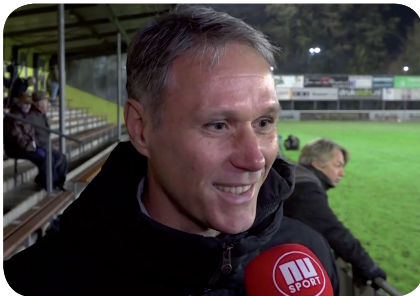
Marco van Basten wordt geïnterviewd tijdens de testwedstrijd in Lisse. De FIFA verwacht van hem voorstellen die zullen leiden tot aantrekkelijker en eerlijker voetbal.

Vooral de experimentele spelhervattingen (2 en 3) ontlokten na afloop veel discussie. Wie zich bezighoudt met de hervorming van de spelregels ontdekt hoe complex de materie vaak is en hoe alles met alles lijkt samen te hangen. En vooral ook dringt zich telkens de vraag op naar de ratio van een nieuwe spelregel: waarom zou de regel zus en