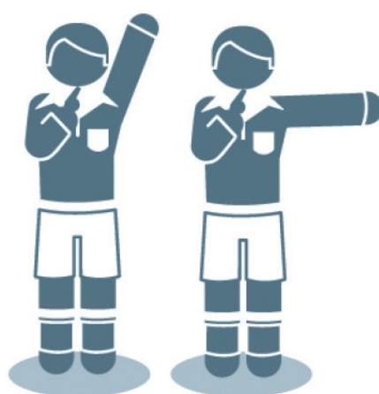
Indirecte Vrije Schop Directe Vrije Schop

Het bovenstaande schetst enkele voorbeelden van hoe de voetbalspelregels effectiever zouden kunnen worden gemaakt en de aantrekkelijkheid van het spel zou kunnen worden bevorderd. In mijn boek behandel ik nog talrijke andere voorstellen en ideeën.