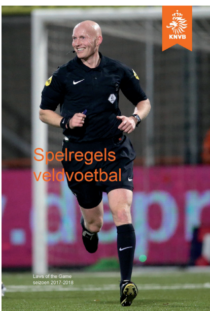
De Nederlandse vertaling van de huidige voetbalspelregels.

De situatie rond The IFAB is geleidelijk in positieve zin aan het veranderen. In het tegenwoordige klimaat kan tenminste worden nagedacht over ingrijpende spelregelreformaties. Experimenten zijn er in de historie van het voetbalspel altijd geweest, maar er lijkt nu meer ruimte voor te ontstaan. Sinds kort laat The IFAB zich adviseren door panels van deskundigen, zoals scheidsrechters en coaches. In 2016 werd de tekst van de spelregels bovendien in zijn geheel vereenvoudigd en aanzienlijk in omvang teruggebracht. Wat wel nog ontbreekt is een kwaliteitszetel in The IFAB voor een wetgevingsjurist die weet hoe je regels opstelt.