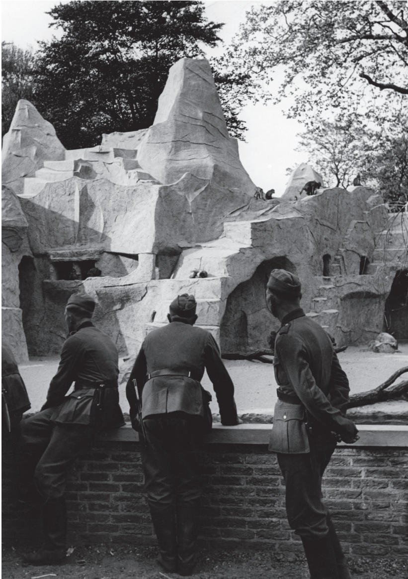
Duitse militairen voor de nieuwe Apenrots aan de Papegaaienvaan. In 1938 bestaat Artis honderd jaar, maar er dreigt een faillissement en dus sluiting door dalende bezoekersaantallen en hoge schulden. Bovendien is de dierentuin dringend aan vernieuwing toe. Met de opbrengst van acties van het Comité Redding Artis kan Artis in 1940 onder andere een Apenrots bouwen. Onderduikers vinden er regelmatig een veilig heenkomen.